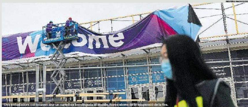
Uns treballadors col·loquen ahir un cartell de benvinguda al Mobile, hores abans de la suspensió de la fira.

La indemnització per les anul·lacions centra ara l'atenció dels afectats