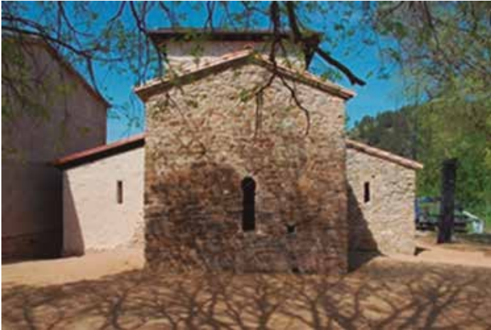
L'església el 2010.