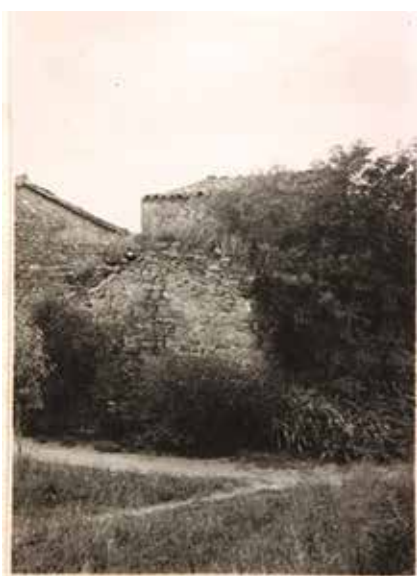
L'església de Matadars el 1934.

L'església és un edifici ben conegut (sobretot per la seva capçalera preromànica) i, atès el seu interès, va ser objecte d'atenció del Servei de Patrimoni Arquitectònic Local, que va fer obres de restauració de la coberta i de l'exterior els anys 1934 i 1935. Tenia la coberta destrossada i una vegetació paràsita exuberant d'arbres i arbusts pertot arreu que malmetia murs i voltes. L'any 1962 hi va tornar a actuar amb obres de manteniment. A partir de la primera meitat del segle XX va passar a diverses mans privades, que van realitzar obres de manteniment i de modificació de l'entorn que al cap dels anys van comprometre l'estabilitat de la construcció. L'SPAL hi va tornar a actuar entre 2003 i 2010 a petició municipal, per tal de preservar la imatge del temple en els seus valors històrics i arquitectònics, i per poder fer una lectura del monument en la seva evolució constructiva al llarg dels segles. Així, es van reparar les cobertes, es van consolidar l'estructura i la volta de la nau amb les seves pintures i es van recuperar la capella nord i l'entorn immediat del temple.