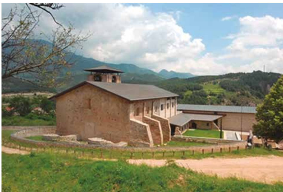
El monestir el 2008.