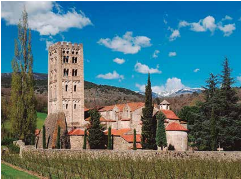
El monestir de Sant Miquel de Cuixà.

Llista dels monestirs del temps d'Oliba restaurats per la Diputació de Barcelona: