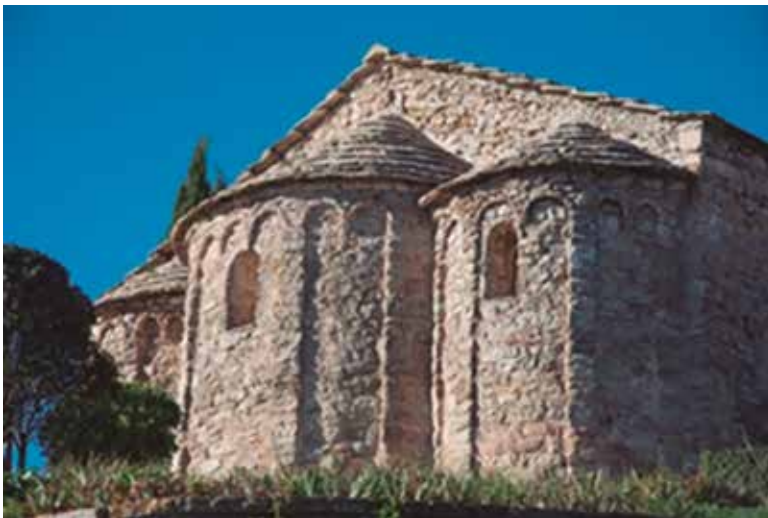
Església de Santa Maria de la Tossa de Montbui (Santa Margarida de Montbui).

Des del bisbat d'Osona, Oliba va impulsar el primer art romànic mitjançant la reforma i construcció de nous temples. El 1038 va consagrar l'església de Santa Maria la Rodona i la catedral romànica de Sant Pere de Vic, de la qual avui es conserva l'esvelt campanar, la cripta i la canònica. També va assistir a la consagració de diferents esglésies, com ara la de Santa Maria de la Tossa de Montbui (cap al 1035), la de Sant Andreu de Castellcir (1038) o la de Santa Eulàlia de Riuprimer (1040).