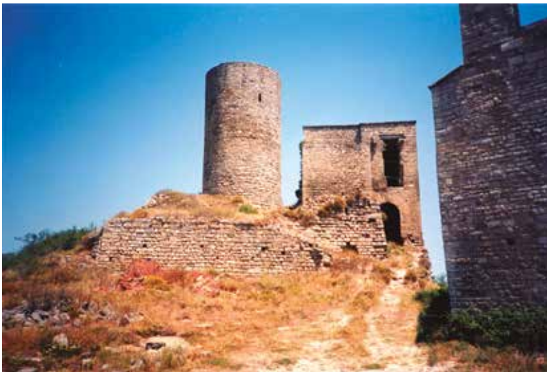
El castell de Boixadors l'any 1996.