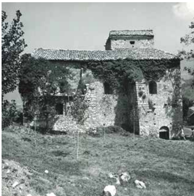
El monestir de Sant Llorenç prop Bagà el 1982.

l'església per recuperar la contemplació de l'espai interior tal com era al segle xv, presidit per la tribuna-cripta de la nau central. També es van restaurar les ales del claustre que quedaven dempeus o en ruïnes. Així, amb la recuperació material i de l'espai arquitectònic, el monestir va recobrar la significació que havia assolit en el passat.