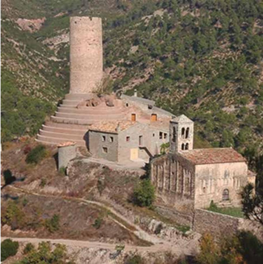
Conjunt de Coaner (Sant Mateu de Bages).

reu d'aquests territoris, va exercir certes funcions administratives i judicials pròpies d'un comte al Berguedà.