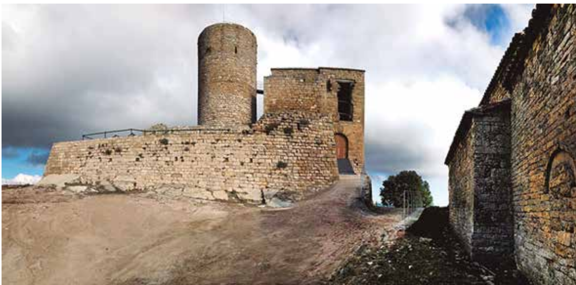
El castell en l'actualitat.