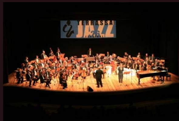
Centre Cultural de la CET

Desde 1999 Picnic Jazz Més de 10.000 persones