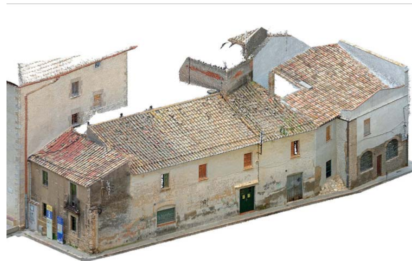
Antiga botiga del castell, Cubelles.