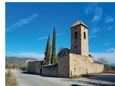
Església de Sant Esteve, Marganell.