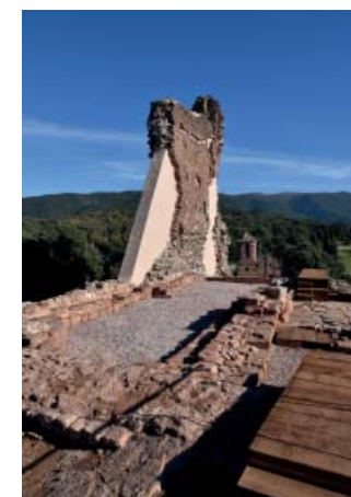
Castell del Brull.