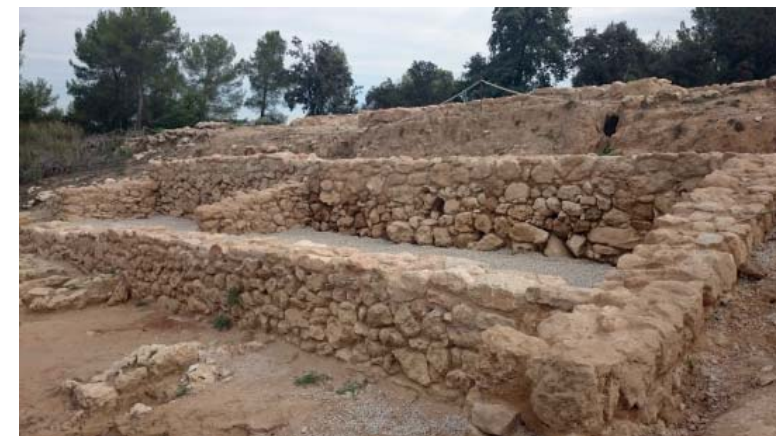
Font de la Canya, Avinyonet Penedes.