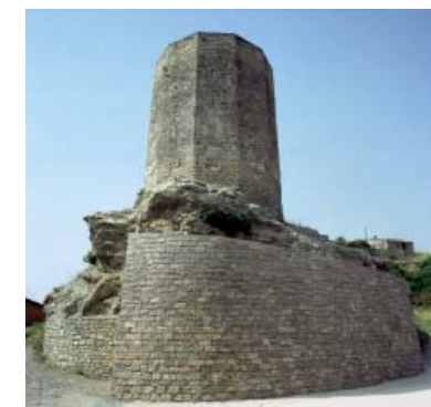
Torre del Castell d'Òdena.