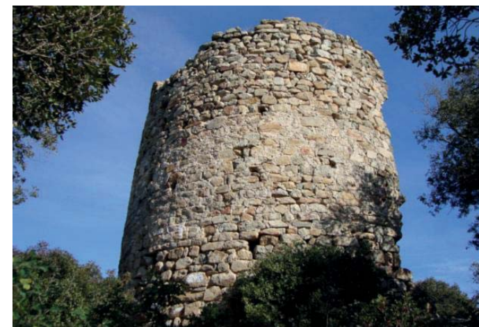
Castell de Sant Miquel, Montornès del Vallès.