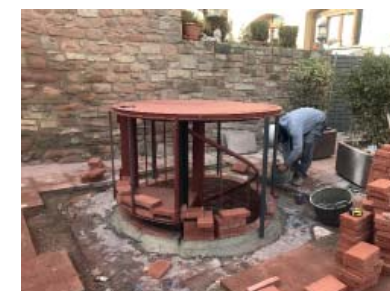
Plaça M. Déu del Portal, Prats de Rei