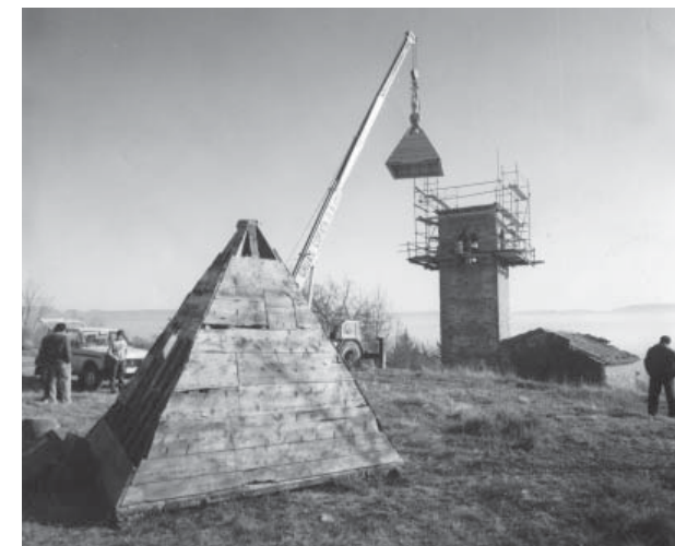
St. Vicenç, Malla.