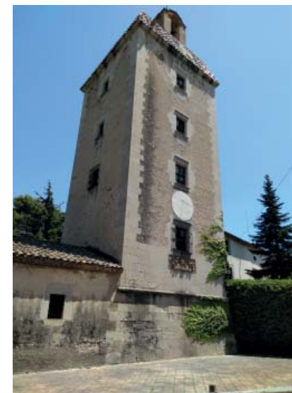
Can Coll, Lliçà de Vall.