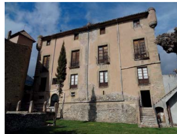
Palau dels Comtes de Centelles.