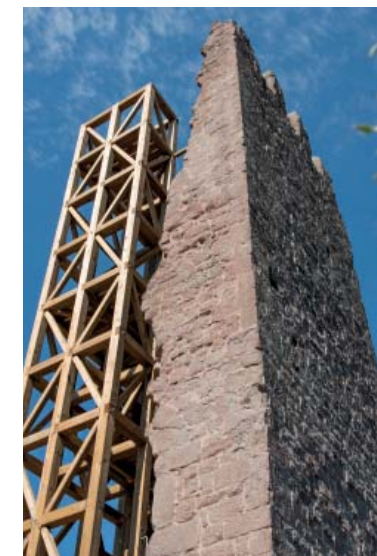
Torre de Merola, Puig-Reig.