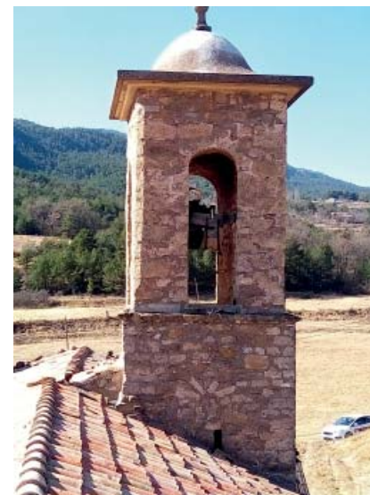
Església de Sant Julià de Fréixens, Vallcebre.