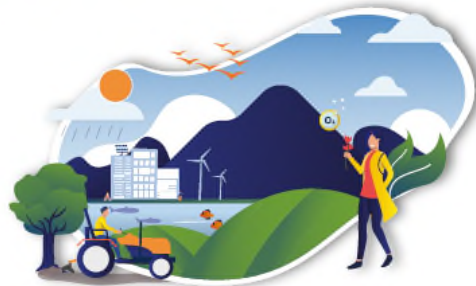
CLIMATE CHANGE MITIGATION AND ADAPTATION