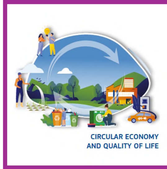
CIRCULAR ECONOMY AND QUALITY OF LIFE