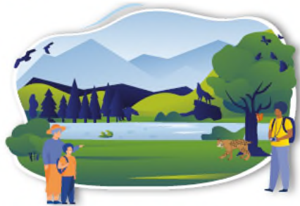
NATURE AND BIODIVERSITY