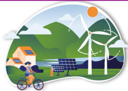
CLEAN ENERGY TRANSITION

European Climate Infrastructure and Environment Executive Agency