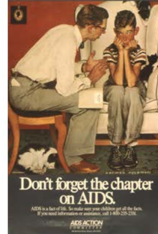
AIDS Action Committee 1987