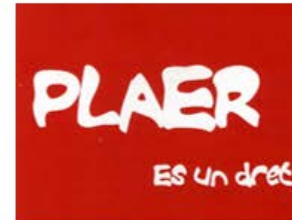
Postal de l'entitat Creación Positiva